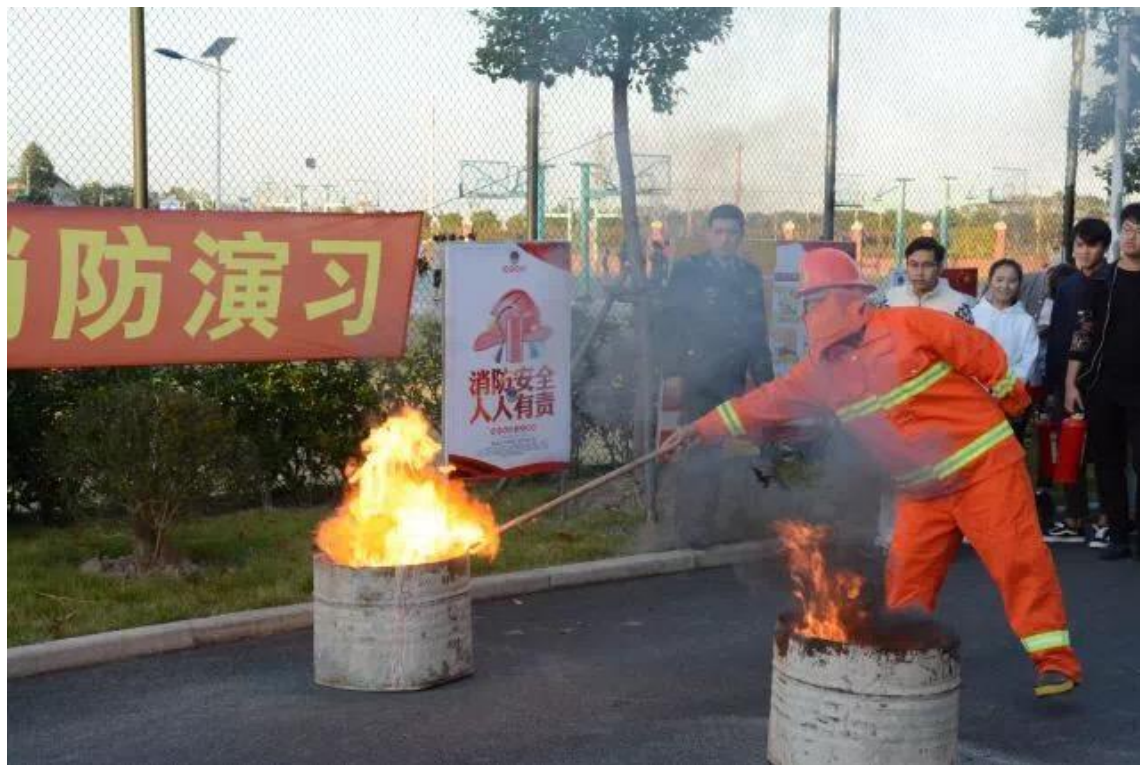
校园消防科普活动